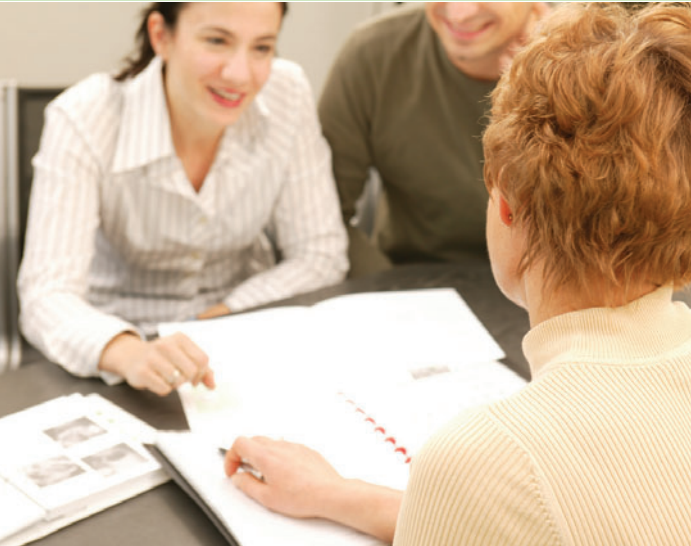
Beratung über die möglichen Ursachen von Fehlgeburten